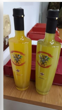
Cravatta - Crest - Vini Liquori - Mascherine