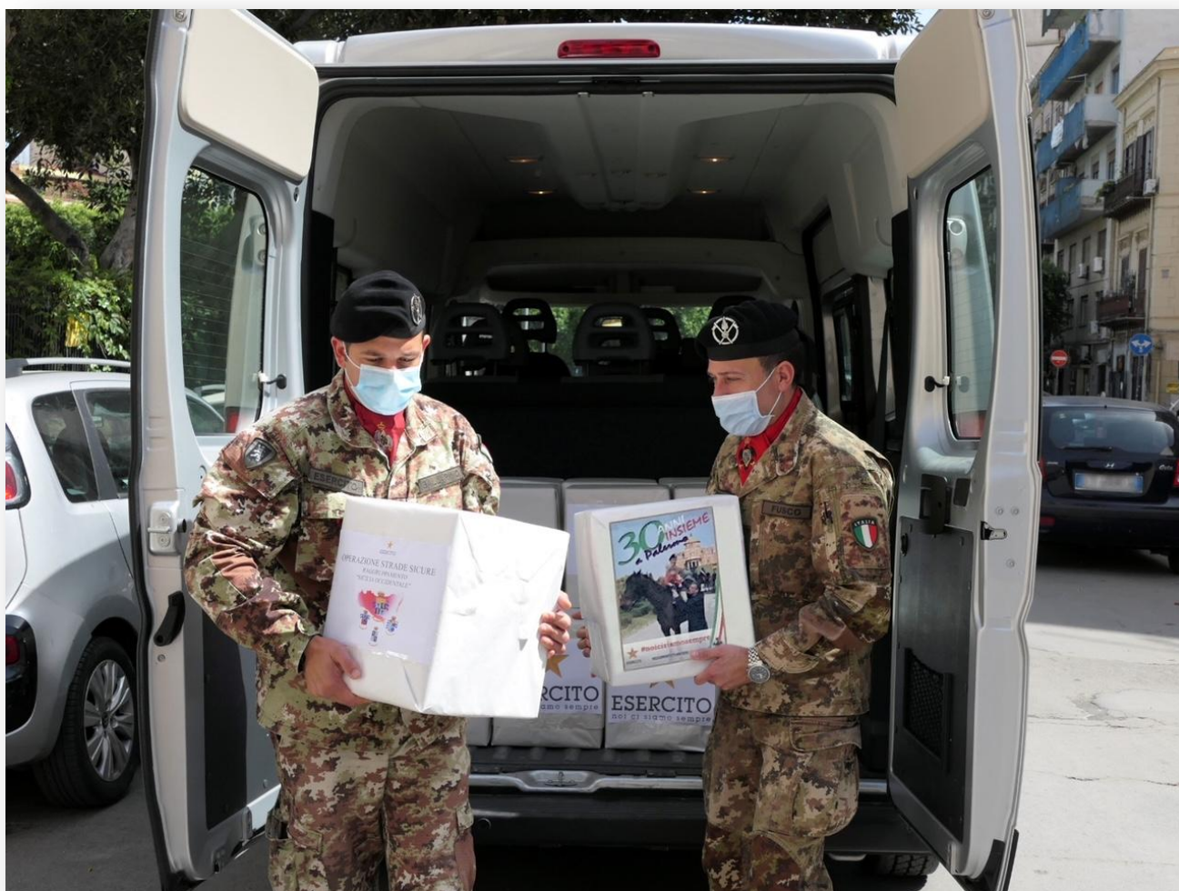
"Rossi Lancieri" provvedono allo scarico dall'automezzo militare dei generi alimentari donati