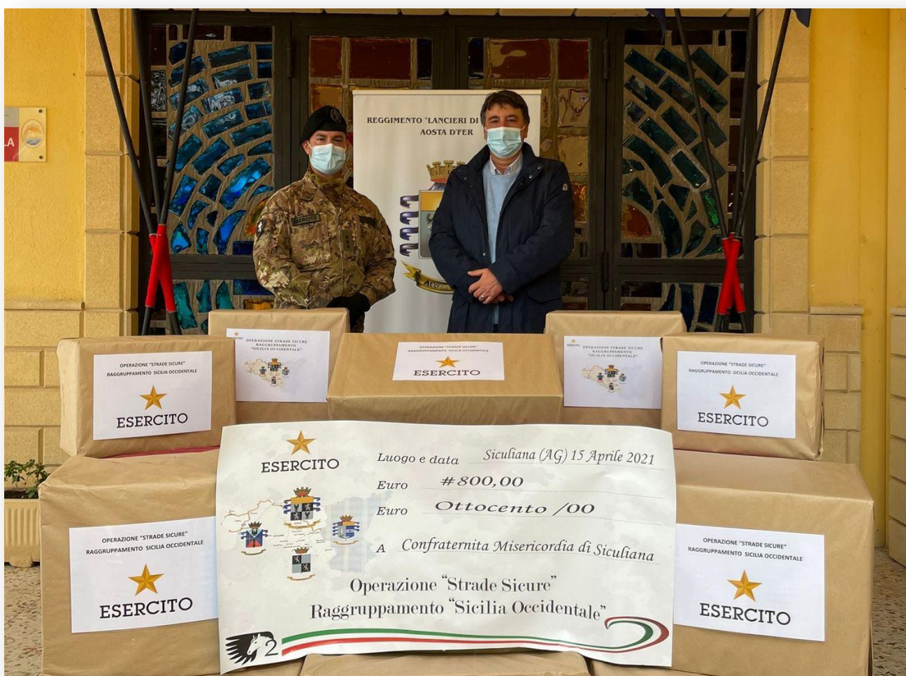
Il Comandante del Sottosettore ed il Sindaco di Siculiana a conclusione della consegna dei generi alimentari e della somma volontariamente raccolta tra i militari dell'Operazione "Strade Sicure"