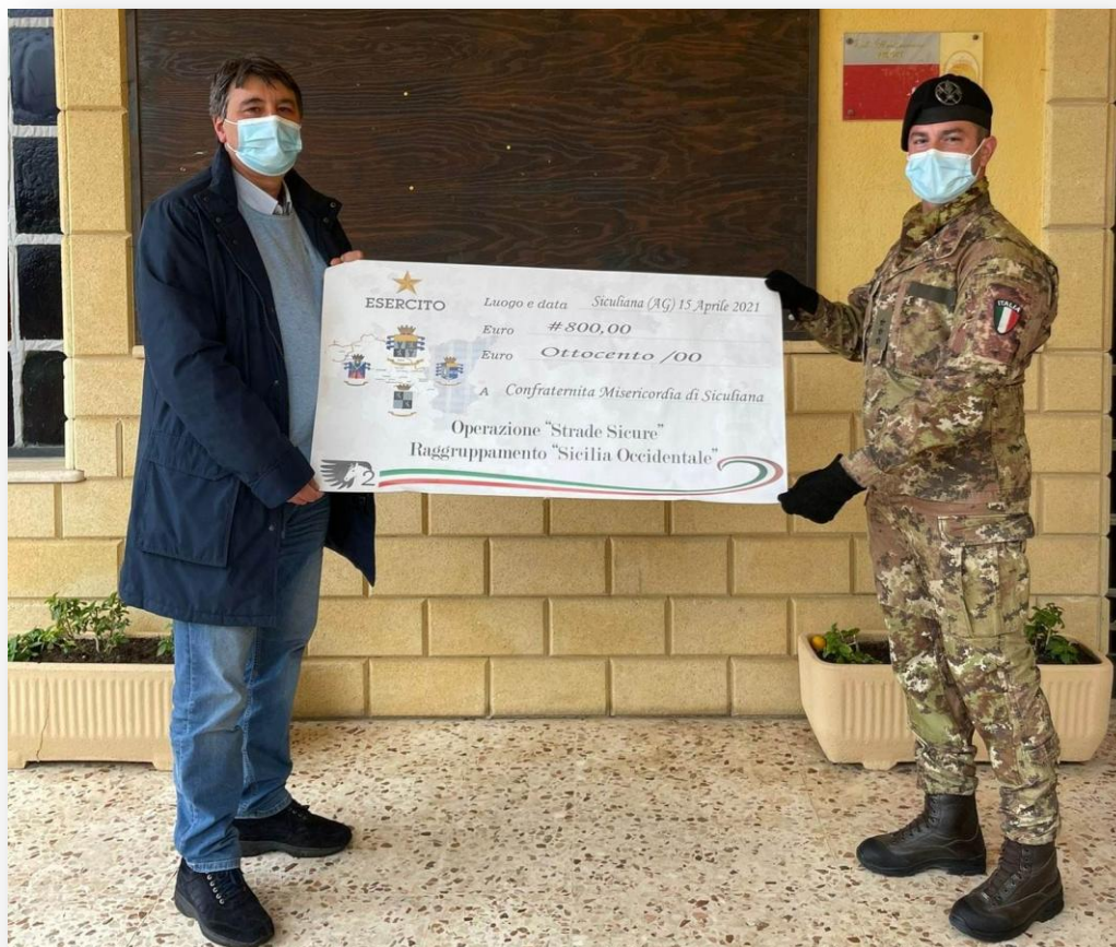
Il Comandante del Sottosettore ed il Sindaco di Siculiana con il mano l'assegno simbolico che rappresenta la volontaria rinuncia di parte dell'indennità di missione dei militari impegnati dell'operazione "Strade Sicure" del raggruppamento della Sicilia Occidentale.